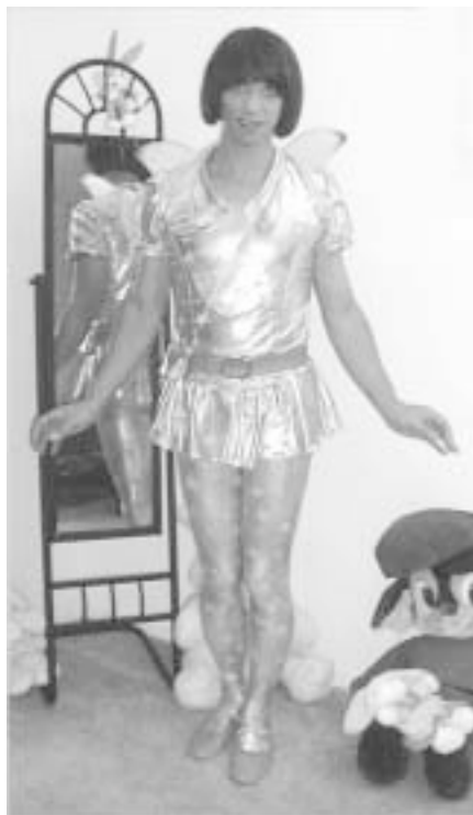
TIL DE METROSEXUELLE