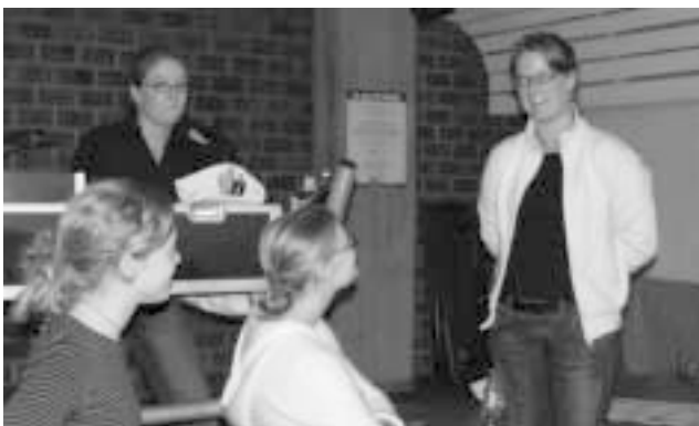
En spændingsmættet situation. Ved spillet om hovedpræmien var der 2 med banko, hvorfor der skulle trækkes lod om, hvem der løb med de 3000,00 kroner til Kilroy sponsoreret af Forstædernes Bank, og hvem der skulle gå tomhændet hjem