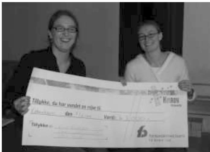
Op en heldig vinder af FADL's julebanko anno 2004 og kroner 3000,00 overrakt af formanden for FADL i København