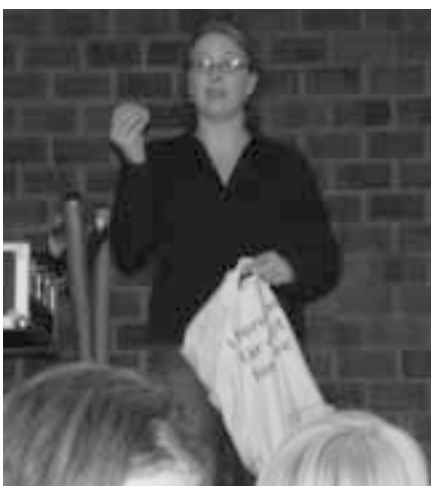
Formanden har fået den tvivlsomme ære at læse numrene op!