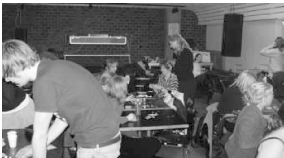
Mange af FADL's medlemmer er klar til kamp om anden og de andre gode præmier!