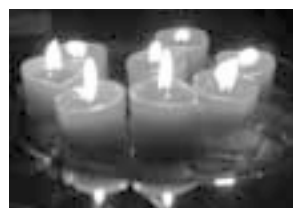
Julestemning. Lysene var røde i virkeligheden