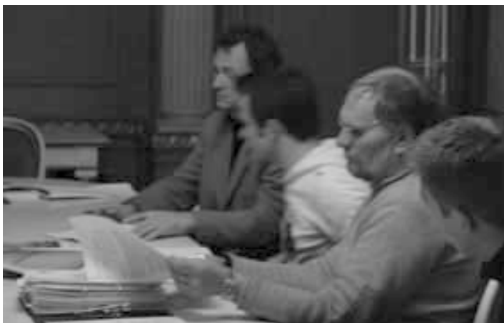
FADL lægger taktik under mødet i forligsinstitutionen