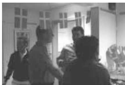
Nye og gamle aktive i FADL snakker om fremtiden i FADL